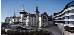
Grandhotel Dolder, Zürich