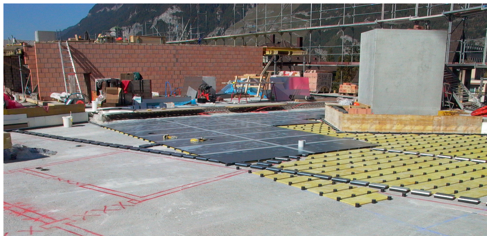
Elastische Bodenlagerung mit Linienlasten während dem Einbau durch Stauffer Schallschutz + Akustik